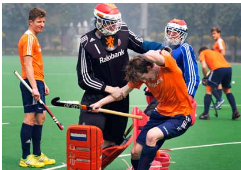
Oog-hand coördinatie is ook in speelse vormen te trainen...

Ontwikkelen is geen rechte lijn. Iedereen heeft zijn eigen leerweg