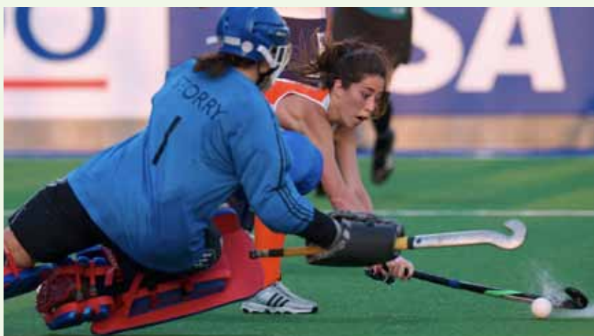
Het fysieke is te trainen; motivatie minder, maar is onmisbaar.

In dit artikel beschouwen we Talenterkenning als het 'kunnen': enthousiasmeren, activeren van afspraken, observeren en inventariseren van de (on)mogelijkheden. Bij Talentontwikkeling ligt het accent op 'doen': dit is de 'natuurlijke' selectie. Hoe is de intrinsieke motivatie, in hoeverre is de speler bereid om in het team te willen functioneren en wil hij zich uitdagen om telkens maar weer beter te willen worden?