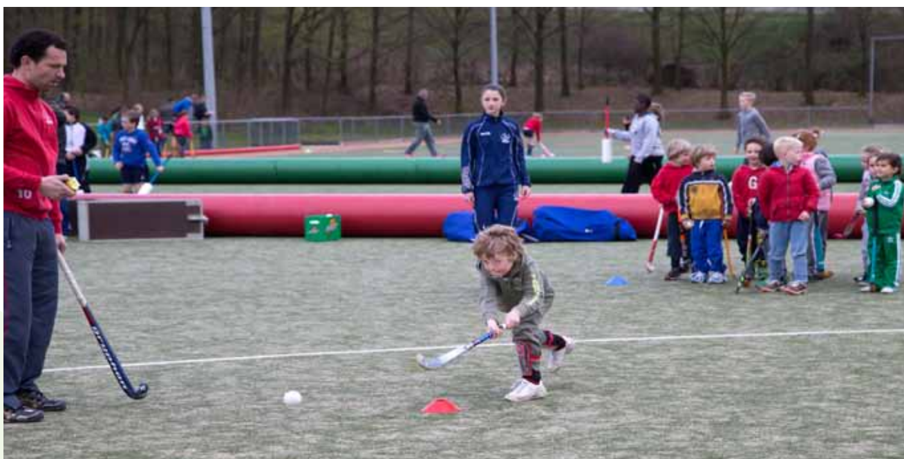
Wanneer weten we of we te maken hebben met een vroegrijper of een laatbloeier?

te zoeken, extra veel aandacht geven aan techniek om deze zo te perfectiëren. Ook hebben zij meer geleerd met tegenslagen om te gaan. Als de laatbloeiërs na verloop van jaren een inhaalslag maken, hebben zij een natuurlijke voorsprong opgebouwd omdat de fysieke component niet meer het verschil maakt. In deze periode is het beoordelen op doorzettingsvermogen en creativiteit ongelooflijk belangrijk.