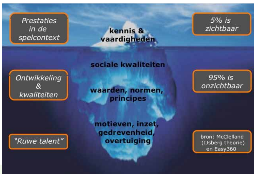
Figuur 1: IJsberg theorie van McClelland.

We moeten ons realiseren dat de kwaliteiten van spelers niet altijd zichtbaar zijn. Denk maar eens aan de 'IJsberg theorie' van McClelland (zie figuur 1). Wat je ziet, zijn voornamelijk de prestaties in de spelcontext. Dat is slechts 5% van het totale pallet van een speler. Onder water zitten