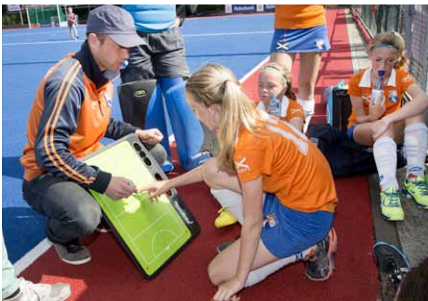
Talenten zitten in alle soorten teams.

De spelers dienen een gezonde nieuwsgierigheid te hebben. Ze moeten het leuk vinden om zichzelf steeds weer te verbeteren, elke week weer, elke wedstrijd opnieuw.