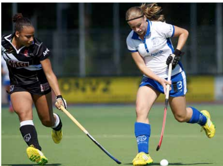
Talenten herkennen is 1, talenten (zich laten) ontwikkelen is 2.

ervaringen en inzichten hebben we een stappenplan gemaakt waarin drie hoofdfases benoemd werden: