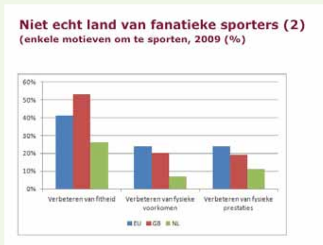
Figuur 3: Niet echt land van fanatieke sporters (2) – motieven om te sporten.