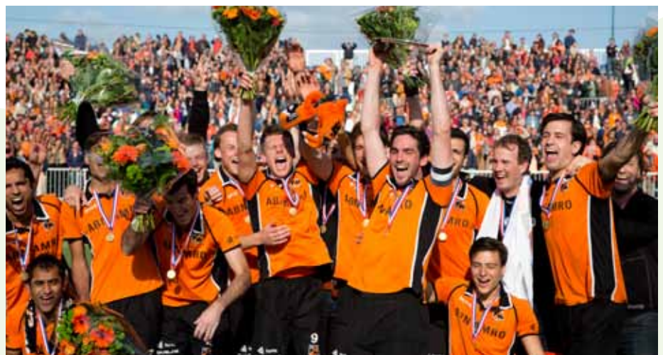
Oranje Zwart als voorbeeld van een topclub met een goede jeugdopleiding.