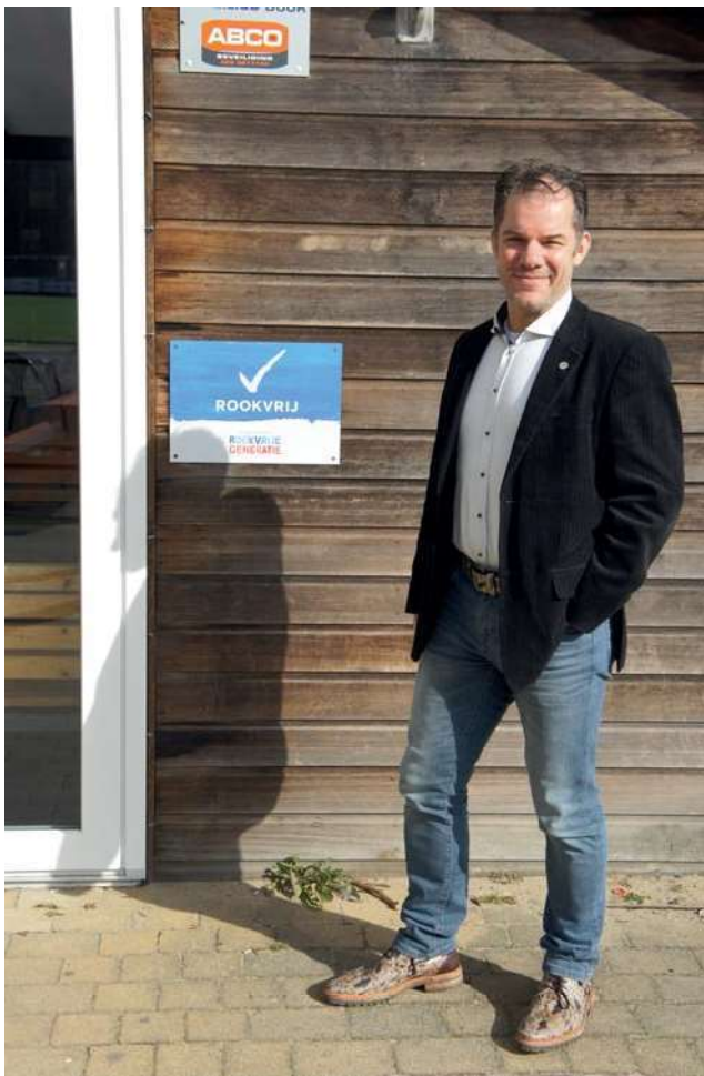
“Van de duizend leden kregen wij van 450 een reactie. Ruim 97 procent was het eens met de stelling of HCM Arnhem een rookvrij sportpark moet hebben”