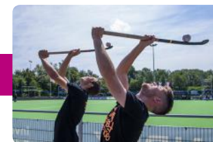
Urban Hockey (kinderen/tieners)