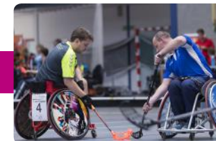
Parahockey (alle leeftijden)