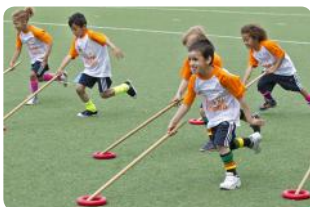
Funkey (4 - 6 jaar)