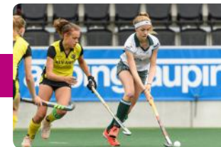
Zaalhockey (alle leeftijden)